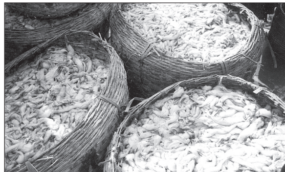
चित्र-1 बड़े बांस टोकरियों में भरी गई बम्बिल पकड

बम्बिल पकड को अच्छी तरह धोकर शीघ्र ही शुष्क हो जाने के लिए आंतडियाँ निकालती है। धूप में सुखायी गयी