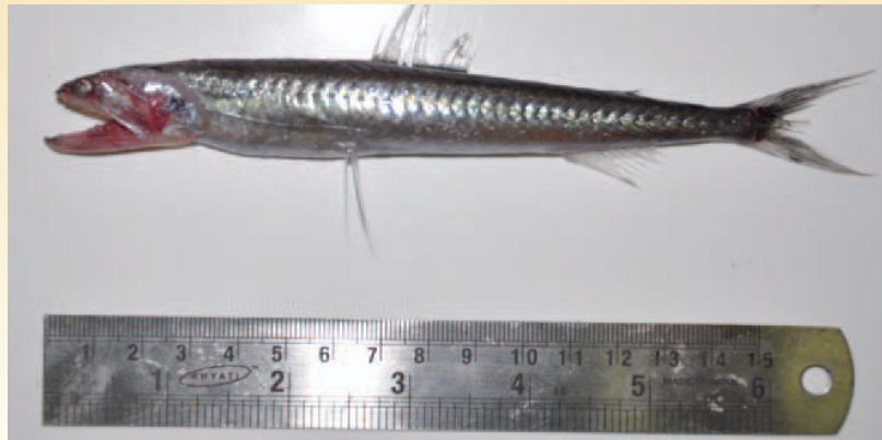
वेरावल से संग्रहित हापोडोन जाति

गभीर सागर मात्स्यिकी संपदाओं के लिए किए गए अन्वेषणात्मक सर्वेक्षण से यह व्यक्त हो गया कि वेरावल के उत्तर अरब सागर की अनन्य आर्थिक मेखला में लगभग 275-310 मी. की गहराई में हापोडोन वंश की मछली जाति मौजूद है, पहले इनकी रिपोर्ट नहीं की गई है। ई एक्स पी ओ आनाय जाल द्वारा इन्हें पकडा गया। पहले उत्तर अरब सागर से केवल एच. निहेरियस की रिपोर्ट की गयी थी। इसकी अपेक्षा नयी जाति छोटा आकार (220 मि.मी.) और बहुत छोटा अंसीय पख (9.4-11.1% की मानक लंबाई) वाली थी। डी एन ए बारकोडिंग (माइटोकोन्ड्रियल जीन साइटोक्रोम ओक्सिडेस सबयूनिट 1 के सी ए 650 बी पी क्षेत्र का अनुक्रमण) और फाइलोजेनेटिक विश्लेषण से यह प्रमाणित हुआ कि नई जाति हापोडोन जाति की मछली है, एच. निहेरियस की नहीं।