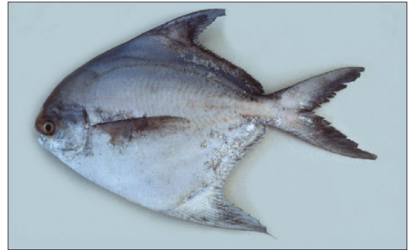
पाम्फेट पाम्पस चिनेनसिस

चीनी पोम्फेटों को मुंबई के ढालीय जलक्षेत्र में और कच की खाडी में 80 मी की गहराई में देखा जाता है। इसकी प्रचुरता वर्षा वर्ष बदलती रहती है और इस प्रकार की भारी पकड साधारण नहीं है, अतः प्रौढ नमूनों की इस प्रकार की अप्रत्याशित पकड की यह प्रथम रिपोर्ट है।