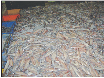
Heavy landing of Needle Squid, Doryteuthis sibogae at Kasimedu Fishing Harbour, Chennai during 24th July, 2008

The needle squid, Doryteuthis sibogae was collected from Cuddalore Fishing Harbour, Tamil Nadu during August, 2008. The length & weight of male squid was 375 mm and 300 gm respectively. The squid was collected through trawl net from south of Nagapattinam fishing area. A total of 3 tons of squid's biomass were collected among 10 trawlers.