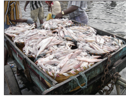
Maximum size Needle Squid Doryteuthis sibogae , found along the Chennai Coast, TN

तमिलनाडू के काशिमेट्टू मात्स्यकी पोताश्रय से जुलाई, 2008 के दौरान नीडिल स्क्विड, डोरिट्यूथिस सिबोगे को पकड़ा गया। आनाय जाल द्वारा भारी मात्रा में इसे पकड़ा गया और 24 जुलाई, 2008 के दौरान 15 टन स्क्विड