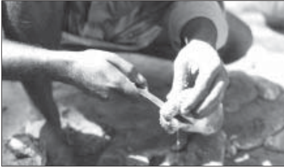
प्रसंस्करण के लिए होलोथूरिया स्काम्ब्रा का कर्तन

आज कल गाढ़ने के बदले में गन्ने की थैलियों में 18 घंटे खुले रखते हैं।