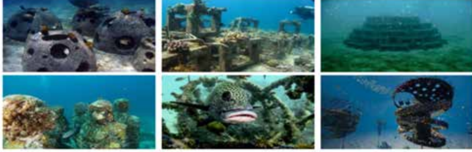
படம் 7: வெவ்வேறு நாடுகளில் வெவ்வேறு நோக்கங்களுக்காக நிறுவப்பட்டுள்ள வெவ்வேறு வகையான செயற்கை மணர்திட்டுகள்

மீறியிருக்கின்றன என்பதை வர்ஜீனிய, கடல் வள ஆதாரங்கள் ஆணையம் கண்டுபிடித்தது. இந்த நிகழ்வு, செயற்கை மணர்திட்டு நிறுவுதல் முறையாக, சட்டங்களைப் பின்பற்றி நடைபெற வேண்டியதன் அவசியத்தை எடுத்துரைக்கிறது. மேலும், செயற்கை மணர்திட்டுகள் அது நிறுவப்படும் கடல் பகுதியின் வள ஆதாரங்களை எவ்வகையிலும் எதிர்மறையாக பாதிக்காது என்பதை உறுதியாகத் தெரிந்து கொள்ள வேண்டிய அவசியத்தையும் அடிக்கோடிட்டுக் காட்டுகிறது.