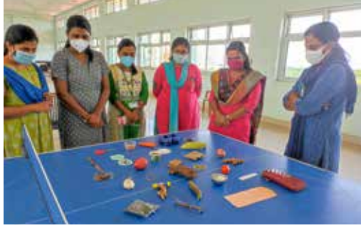
प्रतियोगिताओं के दृश्य

इस दौरान विविध कार्यक्रम, जो कि हिन्दी स्मृति परीक्षा, हिन्दी टिप्पण एवं आलेखन, हिन्दी लेखन, हिन्दी शीर्षक लेखन प्रतियोगिताएं आयोजित की गयीं। 'ई-आफिस में हिन्दी टिप्पणियाँ' विषय पर हिन्दी कार्यशाला ऑनलाइन तरीके से आयोजित की गयी। संस्थान के अधिकारियों एवं कर्मचारियों ने बड़ी रूचि से प्रतियोगिताओं में भाग लिया।