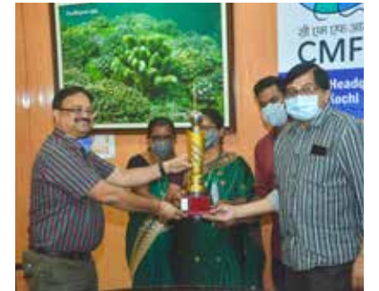
राजभाषा रॉलिंग ट्रॉफी