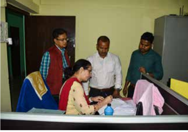
राजभाषा निरीक्षण का दृश्य