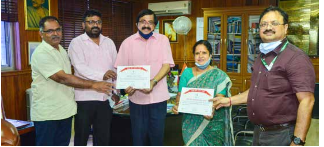
राजर्षि टंडन और गणेश शंकर विद्यार्थी पुरस्कारों के प्रमाण पत्र लेते हुए निदेशक, सी एम एफ आर आइ, मुख्य प्रशासनिक अधिकारी, मुख्य वित्त एवं लेखा अधिकारी, प्रभारी वैज्ञानिक, पी एम ई कक्ष और मुख्य तकनीकी अधिकारी (हिन्दी)

भा कृ अनु प-केन्द्रीय समुद्री मात्स्यिकी अनुसंधान संस्थान को वर्ष 2019-20 के दौरान 'ग' क्षेत्र में स्थित भा कृ अनु प संस्थानों में राजभाषा नीति के उत्कृष्ट कार्यान्वयन के लिए राजर्षि टंडन पुरस्कार (प्रथम स्थान) प्राप्त हुआ। सी एम एफ आर आइ को यह पुरस्कार 11वीं बार प्राप्त हो रहा है। सी एम एफ आर आइ की हिन्दी गृह पत्रिका 'मत्स्यगंधा' के लिए भा कृ अनु प उत्कृष्ट हिन्दी पत्रिका पुरस्कार-गणेश शंकर विद्यार्थी पुरस्कार (प्रथम स्थान) भी प्राप्त हुआ।