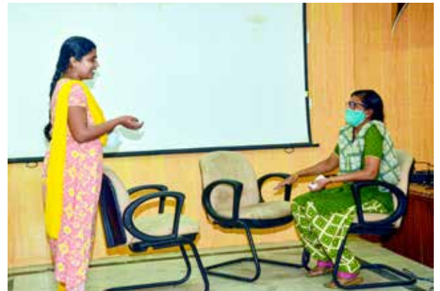
हिन्दी वार्तालाप प्रतियोगिता में पुरस्कार प्राप्त टीमों के दृश्य