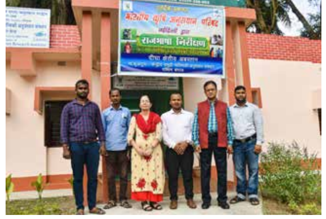
निरीक्षण टीम दिवा स्टेशन के कार्मिकों के साथ