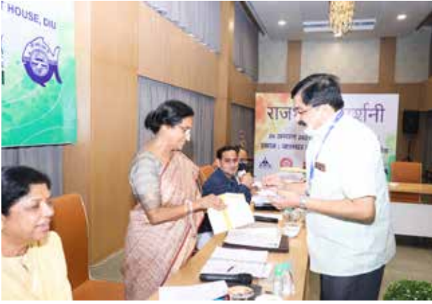
संसदीय राजभाषा समिति की निरीक्षण बैठक के दृश्य

निरीक्षण के दौरान समिति ने राजभाषा नीति के कार्यान्वयन में प्रगति लाने के लिए संस्थान द्वारा किए गए प्रयासों की सराहना की। इसके अतिरिक्त संस्थान की अनुसंधान गतिविधियों और परियोजनाओं के बारे में भी समिति सदस्यों ने चर्चा की।