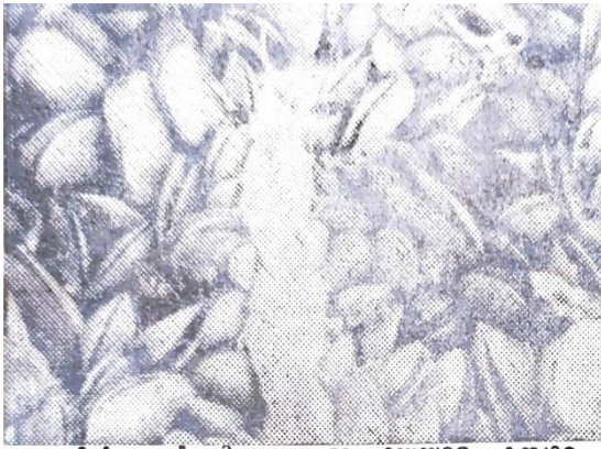
കയറിൽ വളർത്തിയ കല്ലുമ്മക്കായയുടെ കൃഷി.