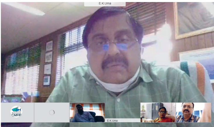
रा भा का स बैठक का दृश्य

संस्थान मुख्यालय, कोचीन में दिनांक 16 से 31 दिसंबर, 2020 तक विविध कार्यक्रमों के साथ स्वच्छता पखवाड़ा मनाया गया। इस संदर्भ में दिनांक 21 दिसंबर, 2020 को ऑनलाइन (वेबेक्स) माध्यम से 'स्वच्छ भारत-स्वस्थ भारत' विषय पर हिन्दी भाषण प्रतियोगिता भी आयोजित की गयी। मुख्यालय और अधीनस्थ केन्द्रों के कर्मिकों ने भाषण प्रतियोगिता में भाग लिया।